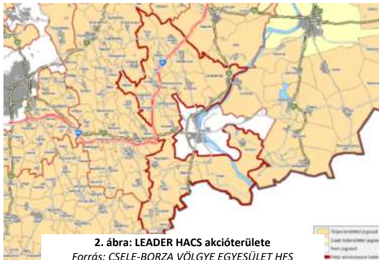
2. ábra: LEADER HACS akcióterülete Forrás: CSELE-BORZA VÖLGYE EGYESÜLET HFS

A kiválasztott akcióterület nincs átfedésben más akcióterületekkel, a Mohácsi járásban kidolgozott LEADER Helyi Fejlesztési Stratégia akcióterülete a város közigazgatási határán kívüli területeket foglalja magába (2. ábra).